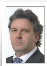
PIETRO EPIFANI Sindaco