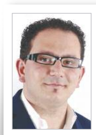
GIOVANNI ALLEGRINI Delega speciale in materia di Agricoltura e Attività Produttive